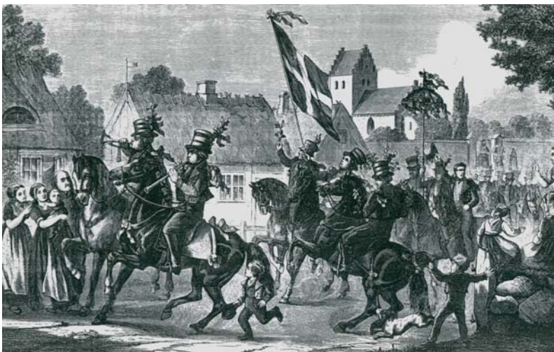
Unge sjællandske bønder ridder ”Sommer i by” ca. 1835. Knud Gamborg, Illustreret tidende 30 juni 1867.

En anden festlig begivenhed var ”Sommer i by”. Disse fester husker Helga fortsatte helt op i halvtredserne. Derudover holdt man gymnastikforeningsballer, chokoladegilder, juletræsfester, høstgilder og også afholdsforeningen i Stubberup indbød til fester med salmer, historiefortælling, kaffe og bal.